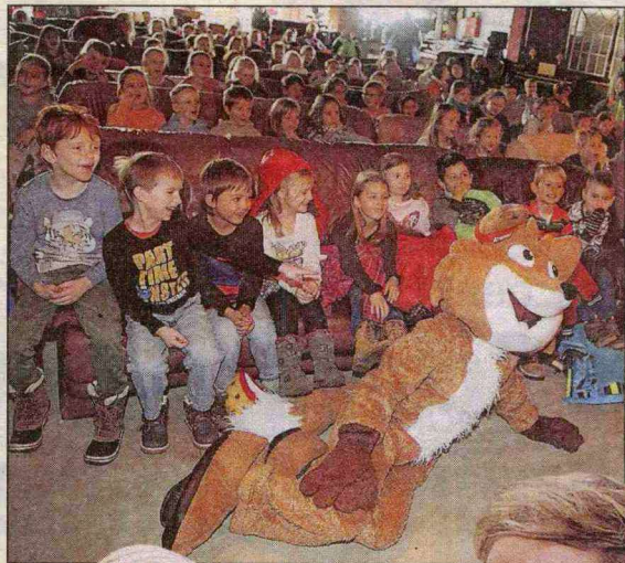
Volles Haus im Eboardmuseum in Klagenfurt: Die Lesungen sind dort immer etwas Besonderes.